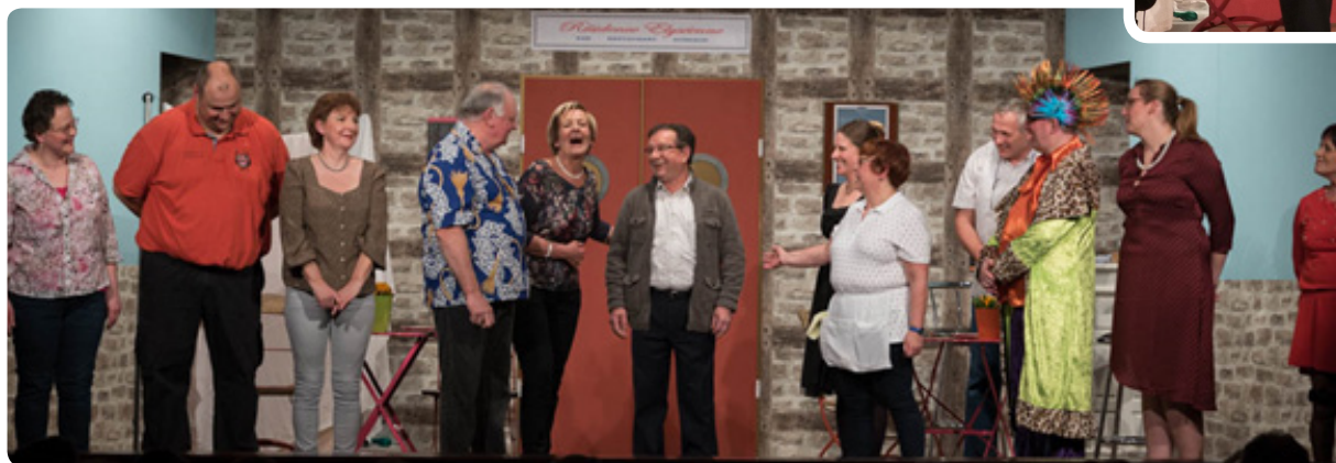
« Amours Présidentielles » de M. Paul Cote © Louis Lezzi