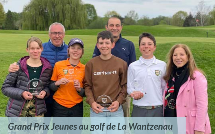
Grand Prix Jeunes au golf de La Wantzenau