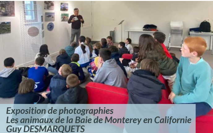
Exposition de photographies Les animaux de la Baie de Monterey en Californie Guy DESMARQUETS