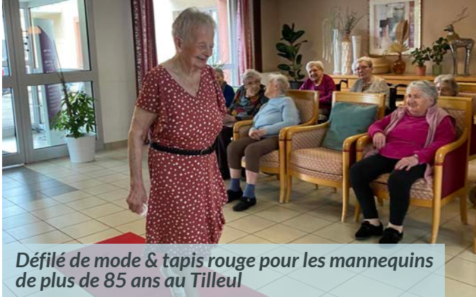
Défilé de mode & tapis rouge pour les mannequins de plus de 85 ans au Tilleul