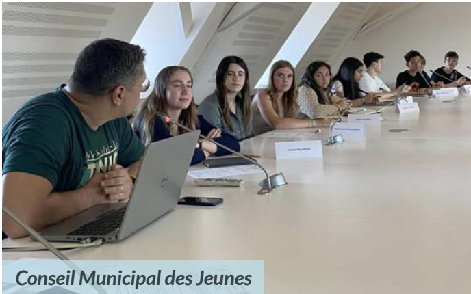
Conseil Municipal des Jeunes