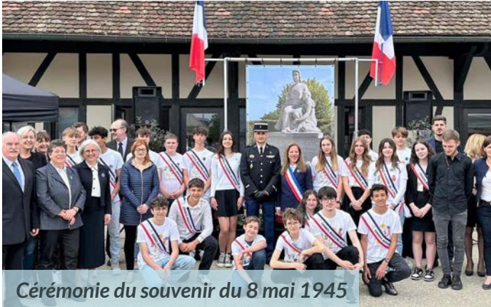
Cérémonie du souvenir du 8 mai 1945