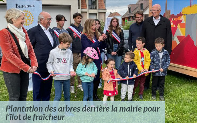
Plantation des arbres derrière la mairie pour l'îlot de fraîcheur