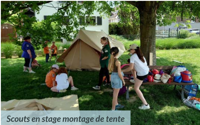
Scouts en stage montage de tente